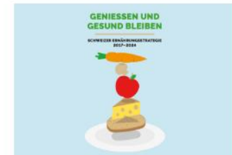
Schweizer Ernährungsstrategie 2017 - 2024